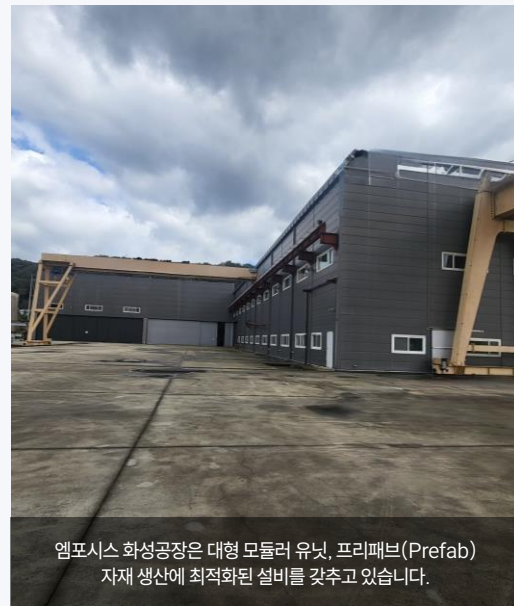
엠포시스 화성공장은 대형 모듈러 유닛, 프리패브(Prefab) 자재 생산에 최적화된 설비를 갖추고 있습니다.