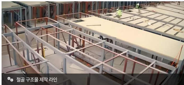
⚙️ 철골 구조물 제작 라인