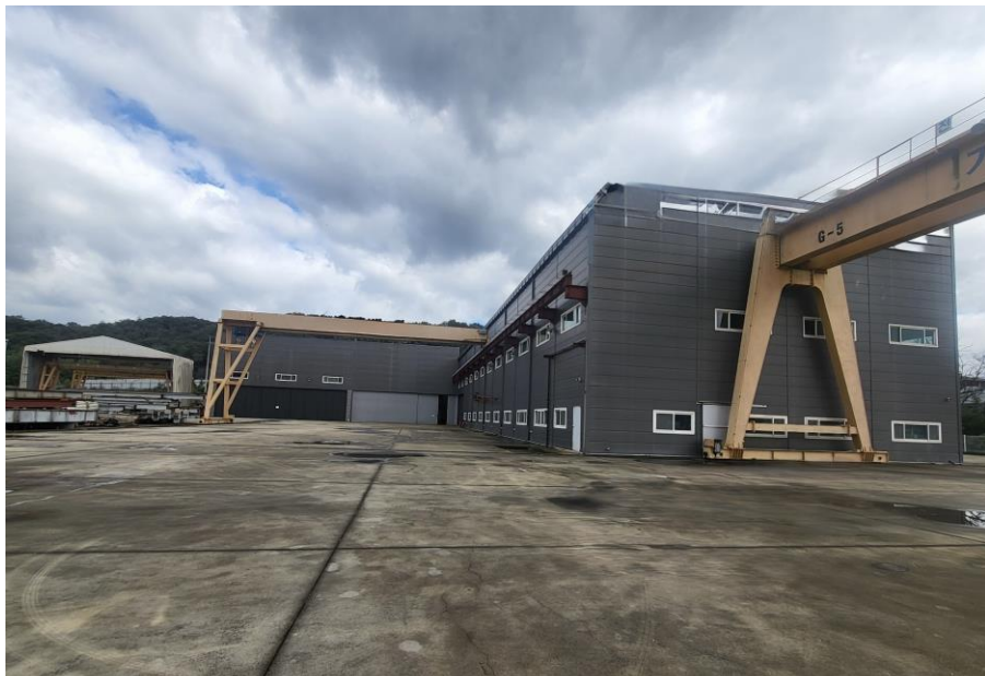
🏠 공장 외부 전경 (1,000평 부지)